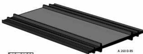
A 260 D-B5